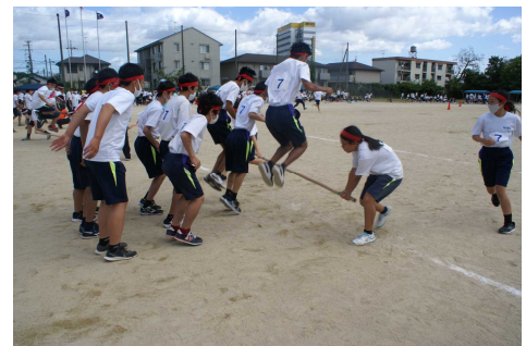
学年種目【草津の風 de PON!】

競技中では、担当の学年が来なかったときに、自ら「同じ委員会なので自分がやります」と仕事をしてくれた2年生がいました。誇りをもって仕事をする責任感ある姿に感動しました。実施できるか心配し、口うるさくマスクの着用を促した淡海祭でしたが、3年生をはじめ、生徒会執行部、ルールを守って取り組んだみんなのおかげで、今回も素晴らしい体育の部を終えることができました。お疲れさまでした。