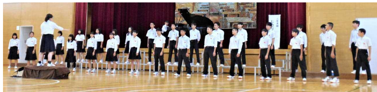
合唱コンクール最優秀賞 5組 {ヒカリ} 指揮: ●●●●さん 伴奏: ●●●●さん

☆5日(月)は昼食後、準備のない生徒は下校します。雨の場合は5、6校時は授業となります。 ☆6日(火)体育の部が雨天中止となった場合は4校時まで授業です。雨天時も弁当はいりません。また、体育の部が7日(水)に順延になった場合は、7日の弁当はいりません。 ☆16日(金)からの青少年美術展は規模を縮小して開催されます。作品を出品した生徒には、後日、詳細をお知らせします。